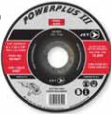
TYPE 1 - THIN / MINCES